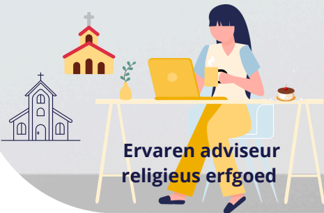
Ervaren adviseur religieus erfgoed